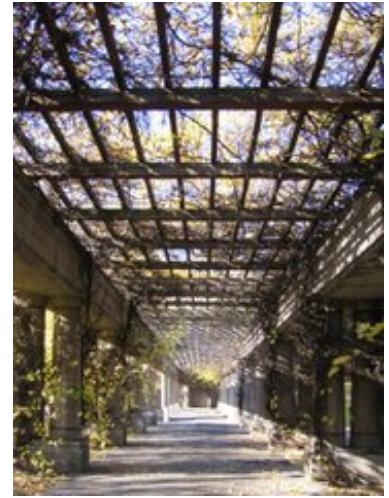
Pergola in einem Park in Breslau

Die Pergola (italienisch zum lateinisch pergula = Vor- beziehungsweise Anbau) ist ein raumbildender Säulen- oder Pfeilergang, der ursprünglich im Übergangsbereich zwischen Haus und Terrasse mehr zur Zierde denn als Sicht- oder Windschutz dient. Heutzutage wird oft auch eine Überdachung zwischen Haus und Garage als Pergola bezeichnet.