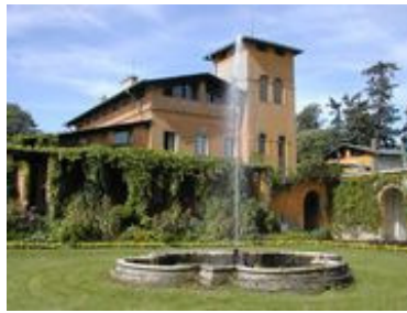
Pergola in den Römischen Bädern, Potsdam