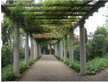
Von Säulen getragene Pergola im Garten der Villa la pietra bei Florenz